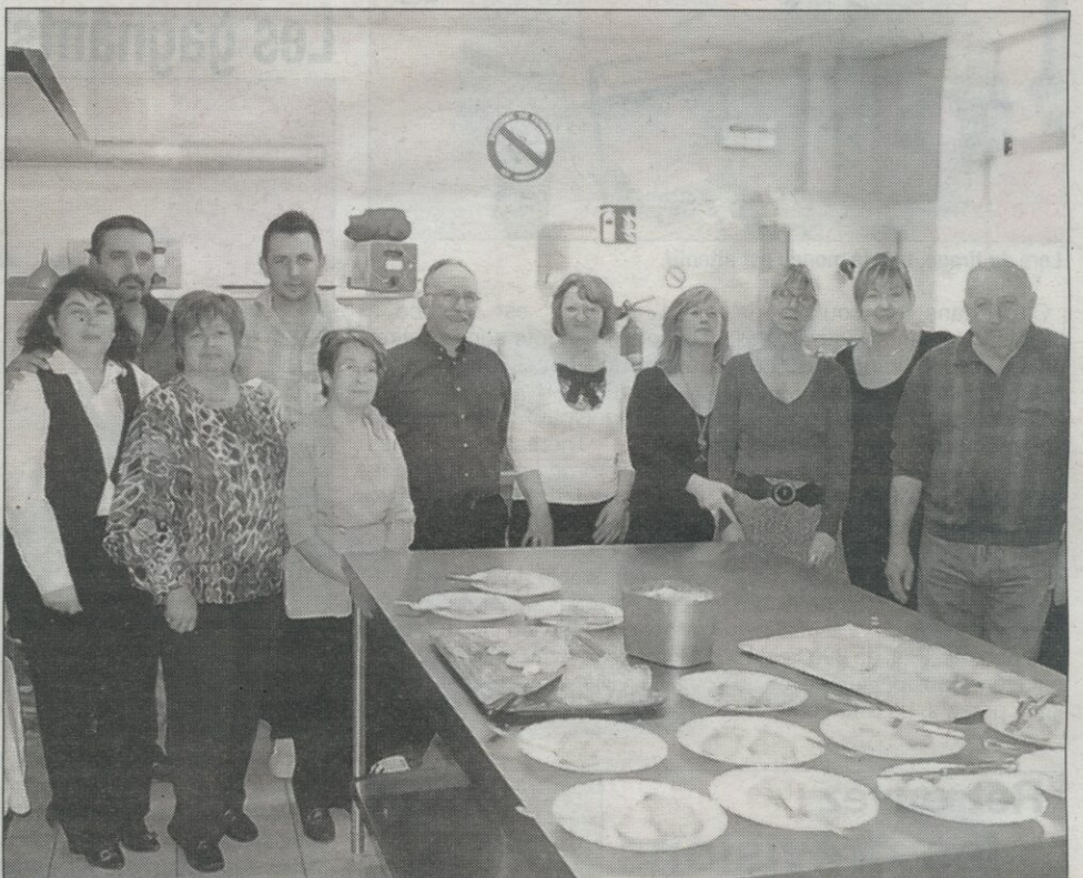
Une équipe de bénévoles pas assez souvent à l'honneur.

L'équipe du centre communal d'aide sociale œuvre durant toute l'année sous la direction